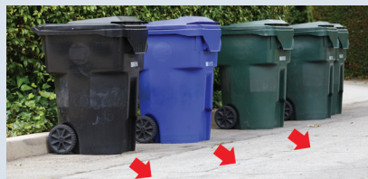
On rainy days, place 3 feet from curb. En días de lluvia, colocar a 3 pies de la acera.

With questions, please contact our Customer Service Department at 800.299.4898 .