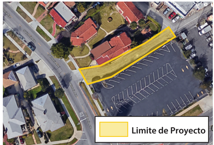
View Park Green Alley